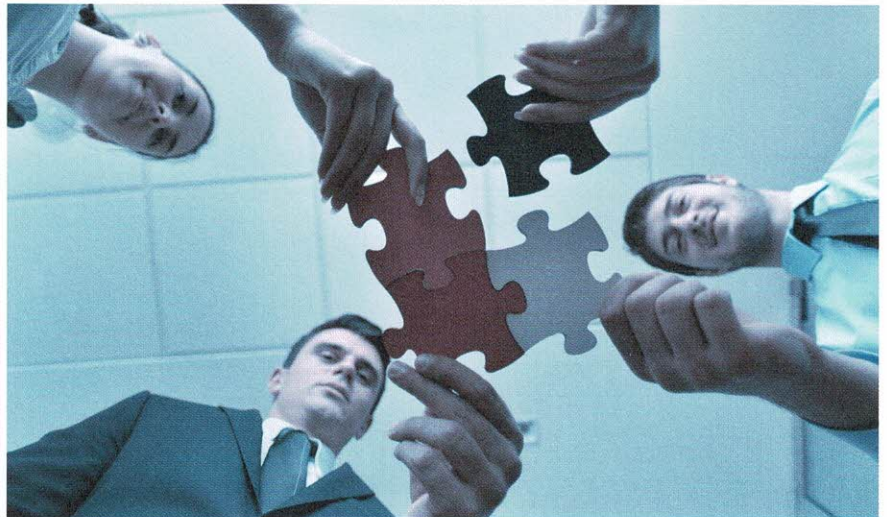
Bei gravierenden Pflichtverletzungen haften die Verwaltungsräte solidarisch. Jedes Mitglied kann für den vollen Schaden belangt werden.

«Eine sorgfältige Mandatsführung minimiert das Haftungsrisiko.»