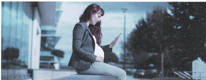
Neben den gesetzlichen Pausen steht Schwangeren alle zwei Stunden eine zusätzliche Pause von zehn Minuten zu.

Die Arbeitnehmerin kann der Arbeit fernbleiben, sie muss aber Bescheid geben. Der Lohn ist nur bei Vorliegen eines Arztzeugnisses geschuldet. Es gelten die gleichen Vorschriften wie bei krankheits- oder unfallbedingten Absenzen. Eine Lohnfortzahlungspflicht besteht, wenn ein unbefristetes Arbeitsverhältnis mindestens drei Monate gedauert hat. Bei einem befristeten Arbeitsverhältnis gilt sie nur, wenn der Vertrag für mehr als drei Monate abgeschlossen wurde. Der Ferienanspruch kann gekürzt werden, wenn die Arbeitnehmerin länger als zwei Monate wegen der Schwangerschaft nicht gearbeitet hat. Ab dem