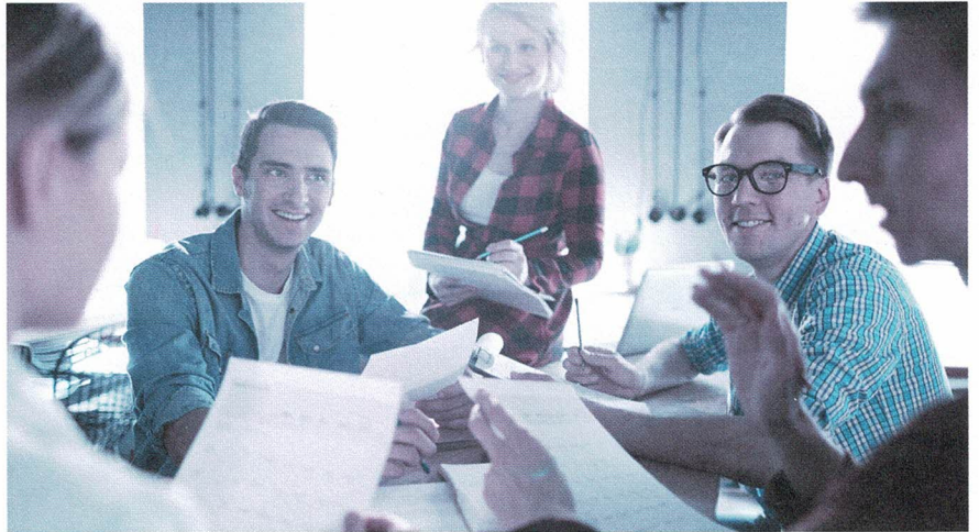
Aktionärbindungsvertrag: ein sinnvolles Instrument, um in guten Zeiten vorausschauende Regelungen für schwierige Phasen zu definieren.

Fast alle Aktionärbindungsverträge sehen Veräusserungsbeschränkungen vor, gerade in Familienbetrieben und Aktiengesellschaften mit wenigen Aktionären. Beispielsweise erwirbt man mit einem Kaufrecht das Recht, Aktien zu erwerben, ohne dass die Zustimmung der anderen Partei erforderlich wäre. Das kann sinnvoll sein, wenn ein Unternehmensaktionär bei der Gründung nicht das ganze Aktienkapital aufbringen kann, aber später den Anlegeraktionär auskaufen will. Vorhandrechte wiederum verpflichten dazu, seine Aktien der anderen Partei anzubieten, bevor ein Vertrag mit einem Dritten abgeschlossen wird. Ein Vorkaufsrecht berechtigt dazu, anstelle eines Dritten zu den Konditionen,