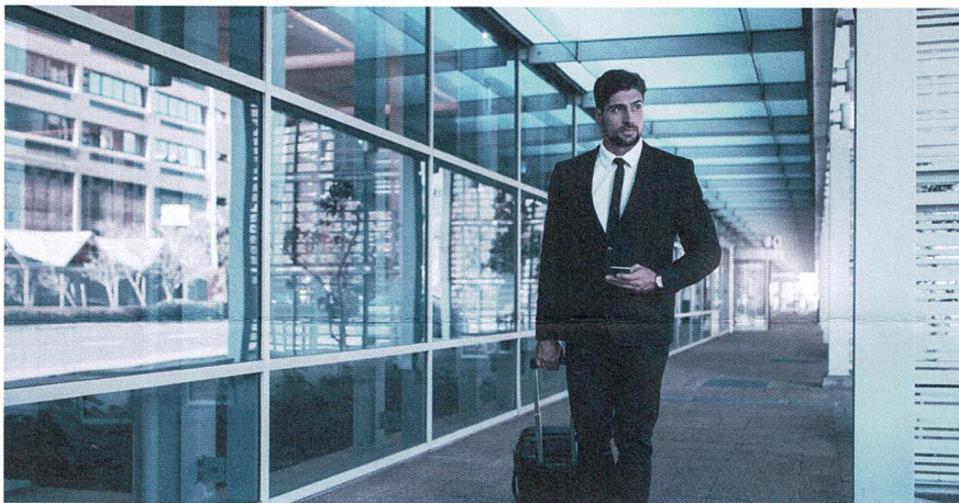
A1-Bescheinigung dabei? Sie ist für alle Aktivitäten im Ausland nötig.

entrichten hat. Es ist für sämtliche grenzüberschreitenden Tätigkeiten nötig, beispielsweise für Berater, Künstler, Journalisten oder Mitarbeiter im Transport oder Baugewerbe, und zwar auch dann, wenn der Aufenthalt nur wenige Stunden beträgt. Ausgestellt wird die A1-Bescheinigung von der AHV-Ausgleichskasse im Wohnsitzland des betroffenen Arbeitnehmers, beantragt wird sie vom Arbeitgeber des Entsandten bzw. direkt vom Selbständigerwerbenden.